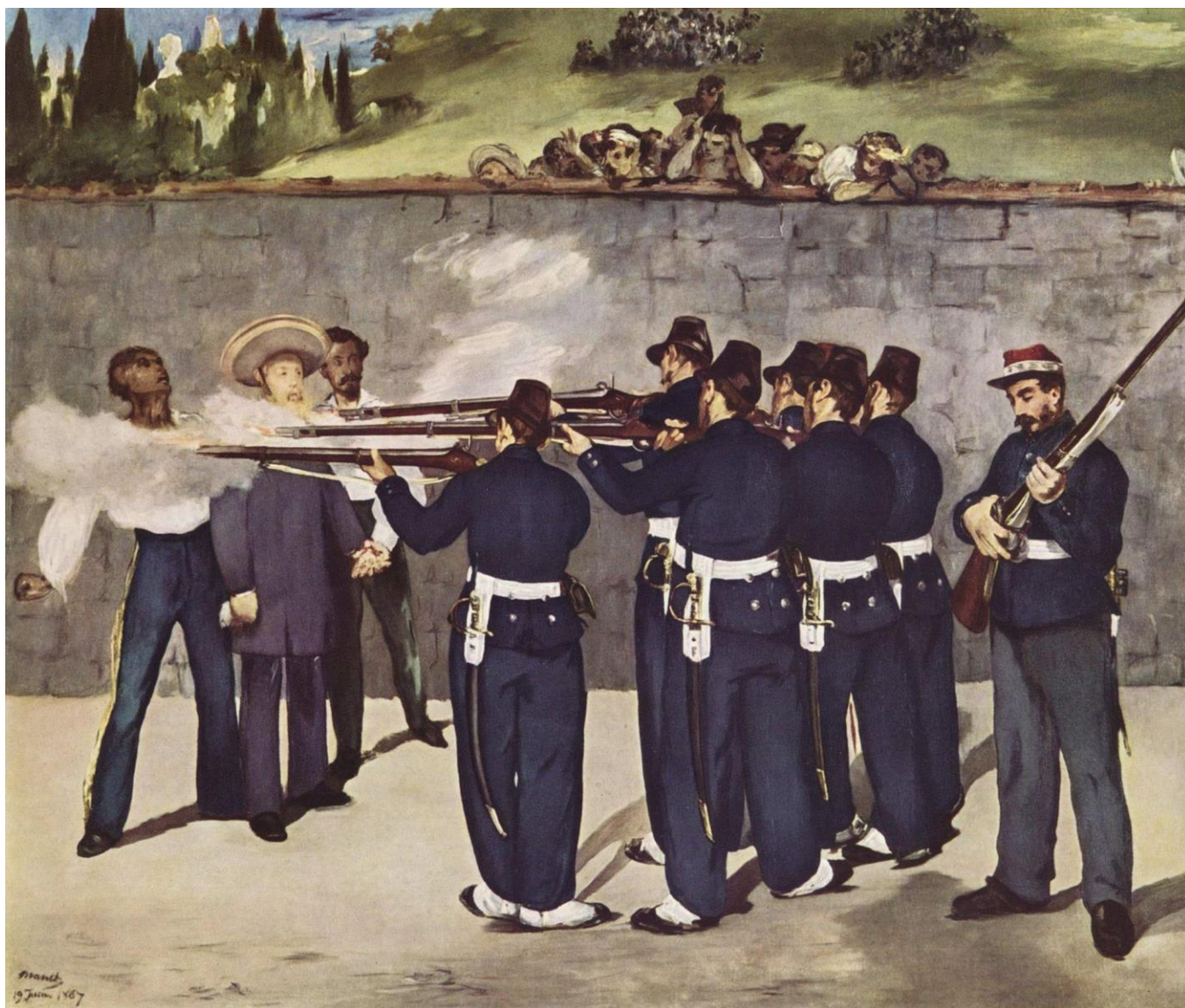
Édouard Manet, L'Exécution de l'Empereur Maximilien du Mexique , peinture sur toile, 1868.