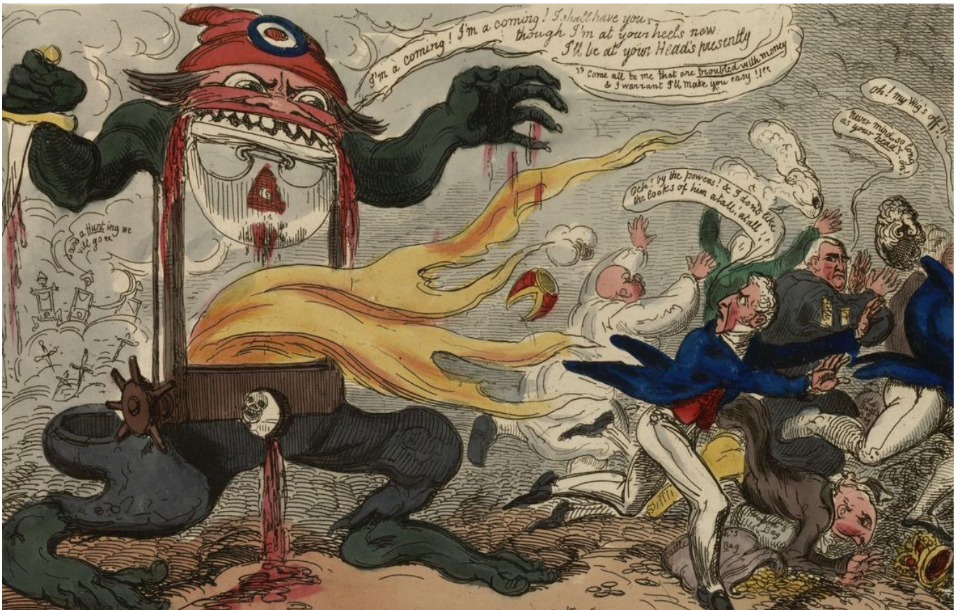
George Cruikshank, A Radical reformer, - (ie) a neck or nothing man! Dedicated to the heads of the nation [Un réformateur radical, ou un homme de cou ou rien. Dédié aux têtes de la Nation], Eau-forte colorée à la main, publiée par Thomas Tegg, 1819.

Illustrations de première page (de gauche à droite et de haut en bas) : Le dragon missionnaire , gravure protestante représentant les dragonnades contre les huguenots français sous Louis XIV, après la révocation de l'édit de Nantes, 1686 | Massacre de la Chapelle arrivé le 24 janvier 1791 , 1791, estampe parue dans le Journal des Révolutions de Paris , n° 81, p. 116 | George Bellows, Drunk Father , 1923 ou 1924, lithographie sur les violences conjugales et violences intrafamiliales.