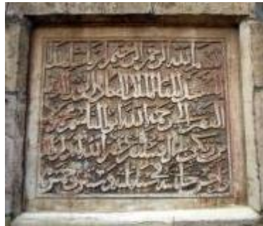
Inscription de la citadelle