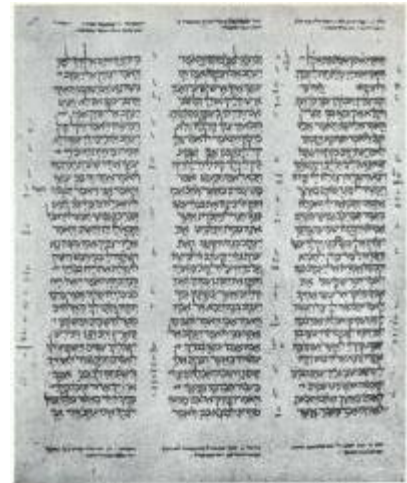
Codex d'Alep (X e s. AD)

Journée d'études organisée par le département d'histoire de l'Ecole normale supérieure et le Centre de formation des journaliste